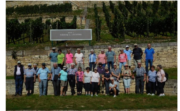
Weinberge an der Unstruth